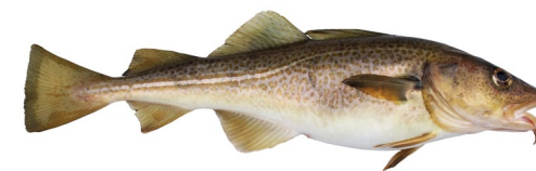
2 Torsk Østersøen