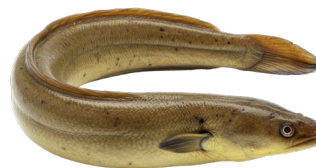
1 Ål Hele Danmark