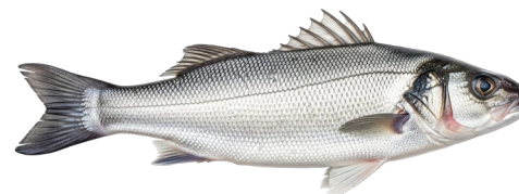
3 Havbars Nordsøen