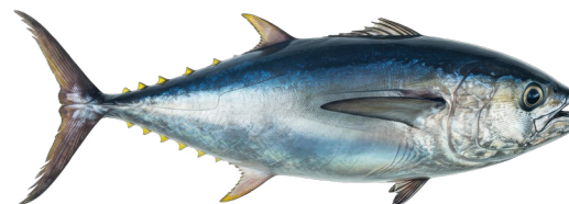
5 Tun Hele Danmark