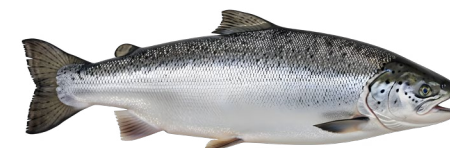
4 Laks Østersøen